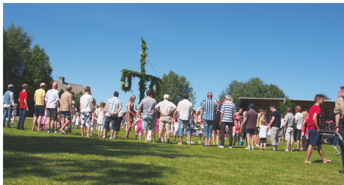
Midsommar i Vännfors

Miss inte en av årets absoluta höjdpunkter: midsommar i Vännfors! Som vanligt så ses vi på fotbollsplanen för att sjunga, fika och dansa kring stången. Vill ni vara med och klä stången? Kom lite tidigare!