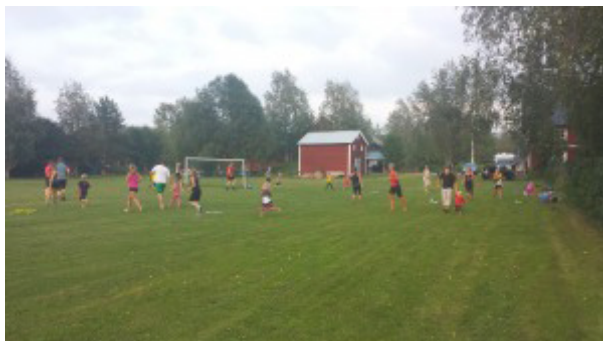
Gymna 2015